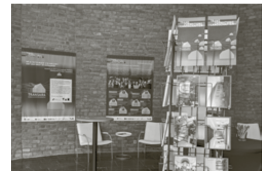
Ausstellungsbanner und Postkartenständer