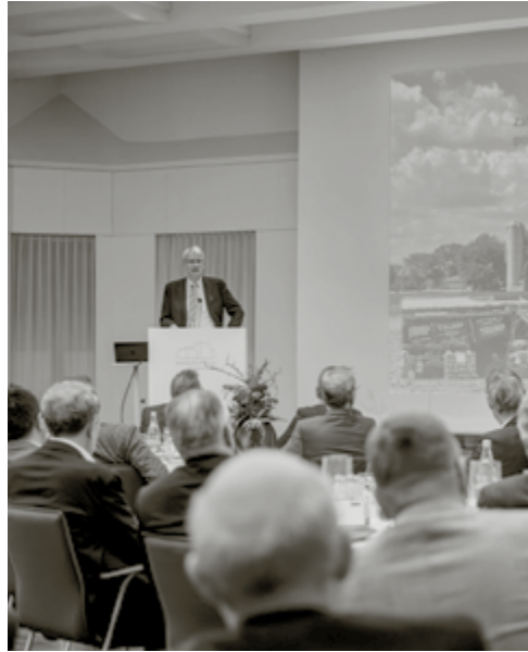
Präsidentenskandidatin Kamala Harris habe sich lange mit persönlichen Angriffen auf Trump zurückgehalten, erklärte Elmar Theveßen. Zuletzt habe Harris Trump dann jedoch einen Faschisten genannt.

Dass die US-Wahl jedoch auch für die Menschen in Deutschland entscheidend ist, stellte Theveßen sogleich klar: »Das Transatlantische Wertesystem ist das erfolgreichste Experiment bezogen auf Demokratie und Gemeinschaft in der gesamten Menschheitsgeschichte.« Um das »gespaltene« Amerika auch den Menschen in Deutschland zu offenbaren, hat sich Elmar Theveßen gemeinsam mit seinem Team auf den Weg gemacht. Mit dem Wohnmobil durchreisten sie zahlreiche Bundesstaaten, legten 9.000 Kilometer in dreieinhalb Wochen zurück. Das Fazit des Journalisten vorweg: Die Sehnsucht der Menschen nach einem einigen Amerika sei nicht stark genug, um die vorhandenen Gräben zu überwinden. Amerika befinde sich auf einer Reise ins Ungewisse.