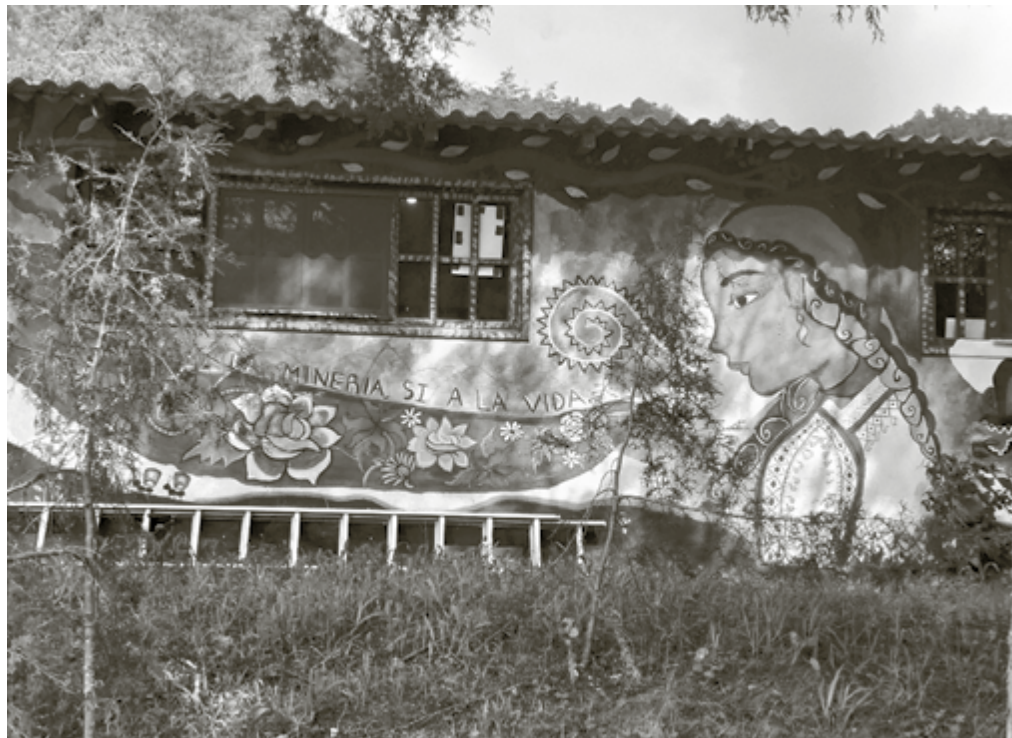
Gebäude einer interkulturellen Universität