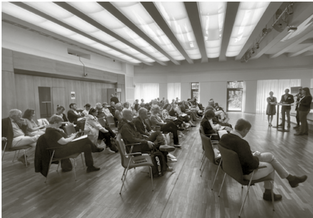
Ein interessiertes Fachpublikum kam im Großen Saal der Katholischen Akademie Schwerte zusammen.