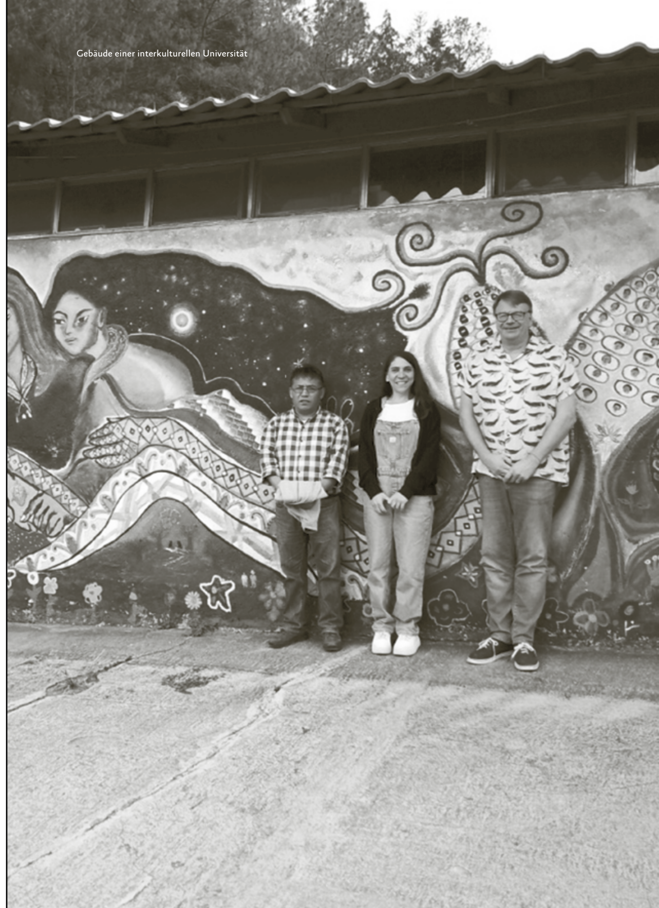
Gebäude einer interkulturellen Universität