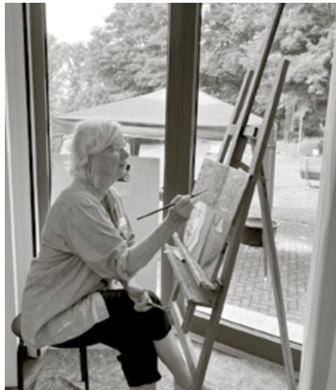
Auf der Suche nach »Gegensätzen« in der Acrylmalerei

beindruckende Arbeiten (z. B. für die eigene Wohnzimmerwand oder als Geschenk für Freunde). Es ist eben tatsächlich ein sehr großer Unterschied, ob man Kunst nur als unerreichbares Kulturgut rezipiert – oder sich selbst in das große Abenteuer der eigenen künstlerischen Kreativität begibt und etwas aus sich heraus schafft. Sobald